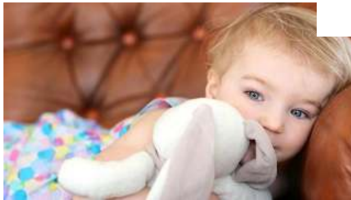
אין מה לדאוג - זה לא לנצח

אל תתחילו לדאוג אם הילד מראה סימנים של תלות בחפץ מעבר. היקשרות ותלות הם לא סימנים של חוסר ביטחון, אלא סימנים לקשר חזק בין הורה לילד. ילד שמחפש נחמה בחפץ הוא בדרך כלל ילד שהוריו ממלאים את צרכיו בכל הנוגע לאהבה וחום.