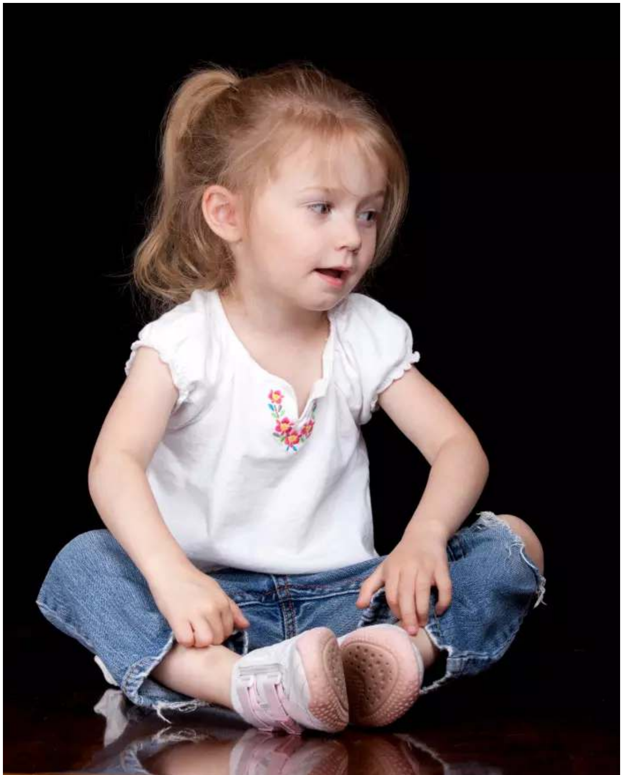
ילדים אוהבים לדבר, ויש להם כשרון טבעי לשפות. ילדה מדברת