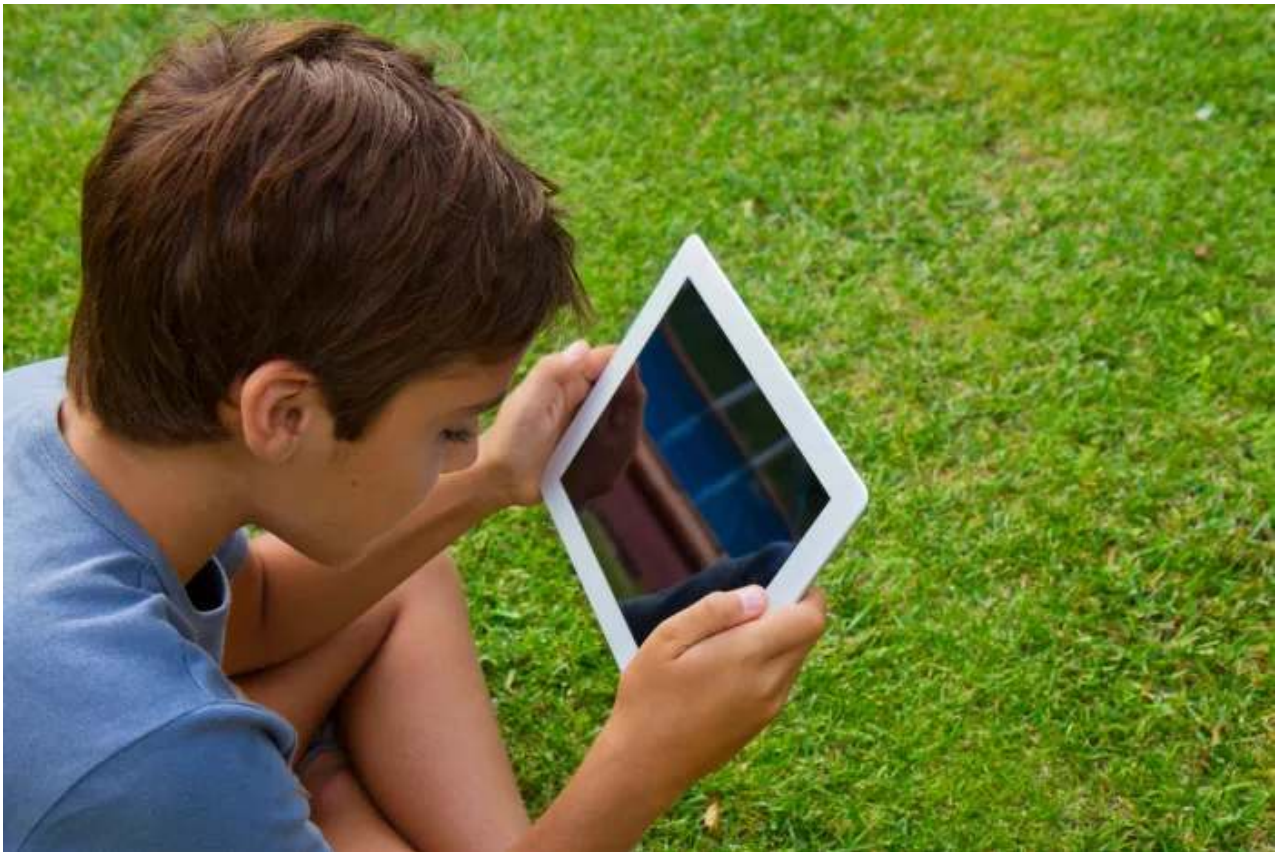
גם מסכים זה בסדר, כל עוד זה לא בהגזמה. ילד עם טאבלט