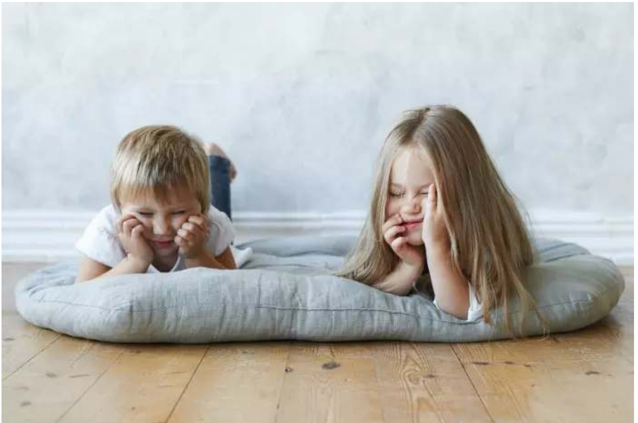
משעמם להם? בעיה שלהם, לא שלכם. ילדים משועממים