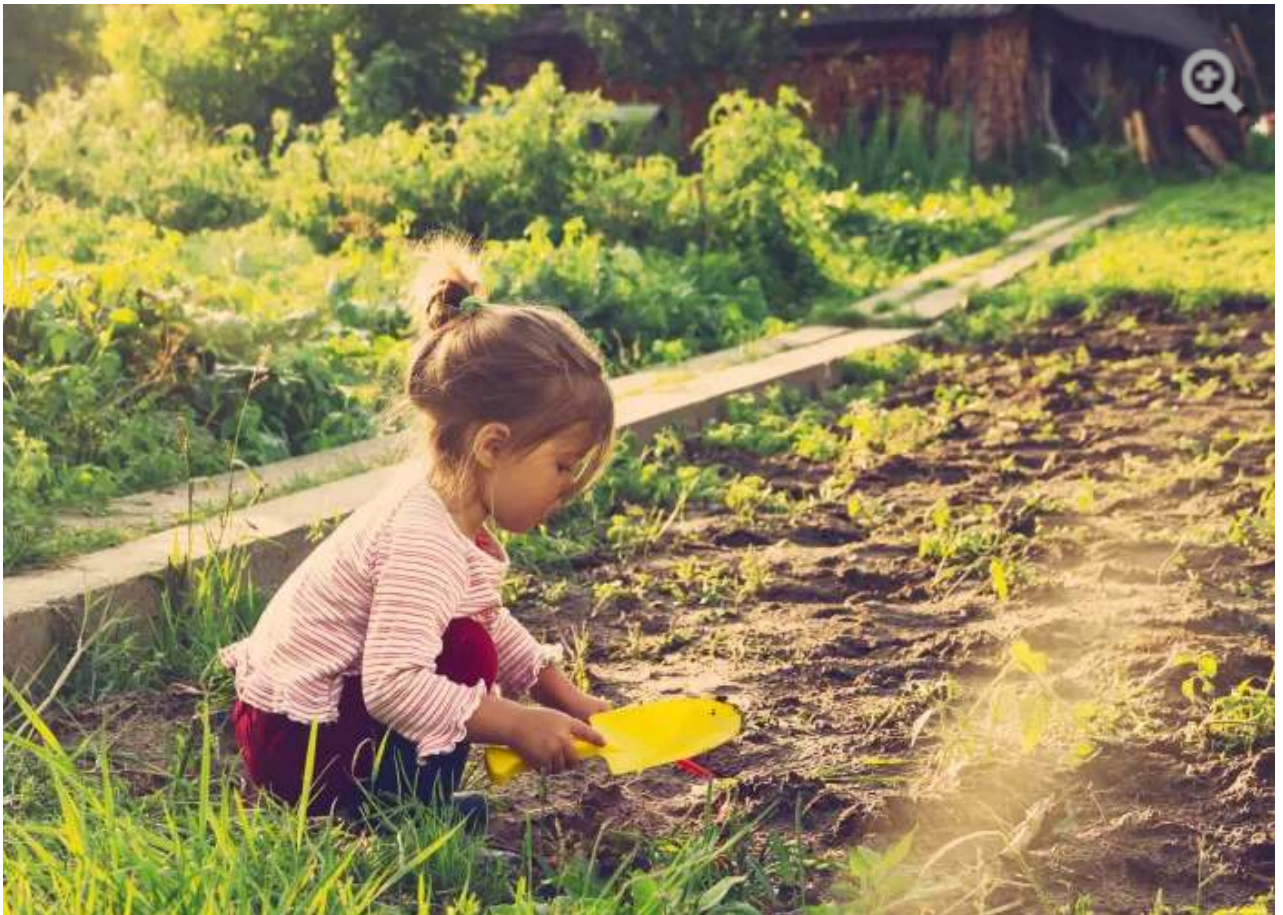
תנו להם חופש לחקור ולבחור לאן הלב שלהם מוביל אותם. ילדה משחקת בגינה

שעמום אצל ילדים הוא כבר לא הבעיה של הילדים עצמם אלא שלנו, ההורים. אנחנו מבזבזים המון אנרגיה במרדף אחרי פעילויות חינוכיות שימלאו את זמנם, על חשבון זמננו ואם לא נצליח למלא כל שעה בפעילות העשרה, מה יחשבו עלינו? לא מעט מחנכים ואנשי מקצוע מסכימים שלפעמים כדאי לתת לילדים את החופש להחליט איך להעביר את זמנם החופשי ולהרשות להם גם להשתעמם ואז גם להחליט לבד איך להפיג את השעמום. חלקם מאמינים שיש לאזן בין הידע שהילדים רכשו במשך עשרה חודשים עם זמן חופשי שבו הילדים חופשיים לתת למוחות שלהם מנוחה ולצבור כוחות מחודשים לשנה החדשה.