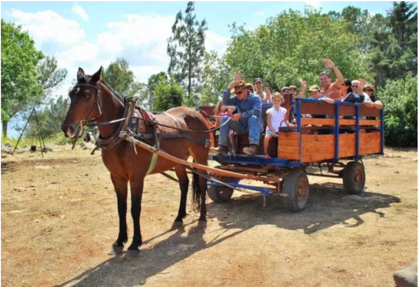
קייטנה בחוות ורד הגליל