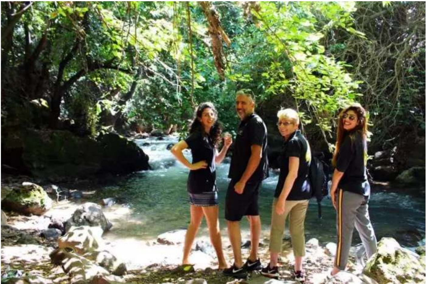
קייטנת סבא וסבתא