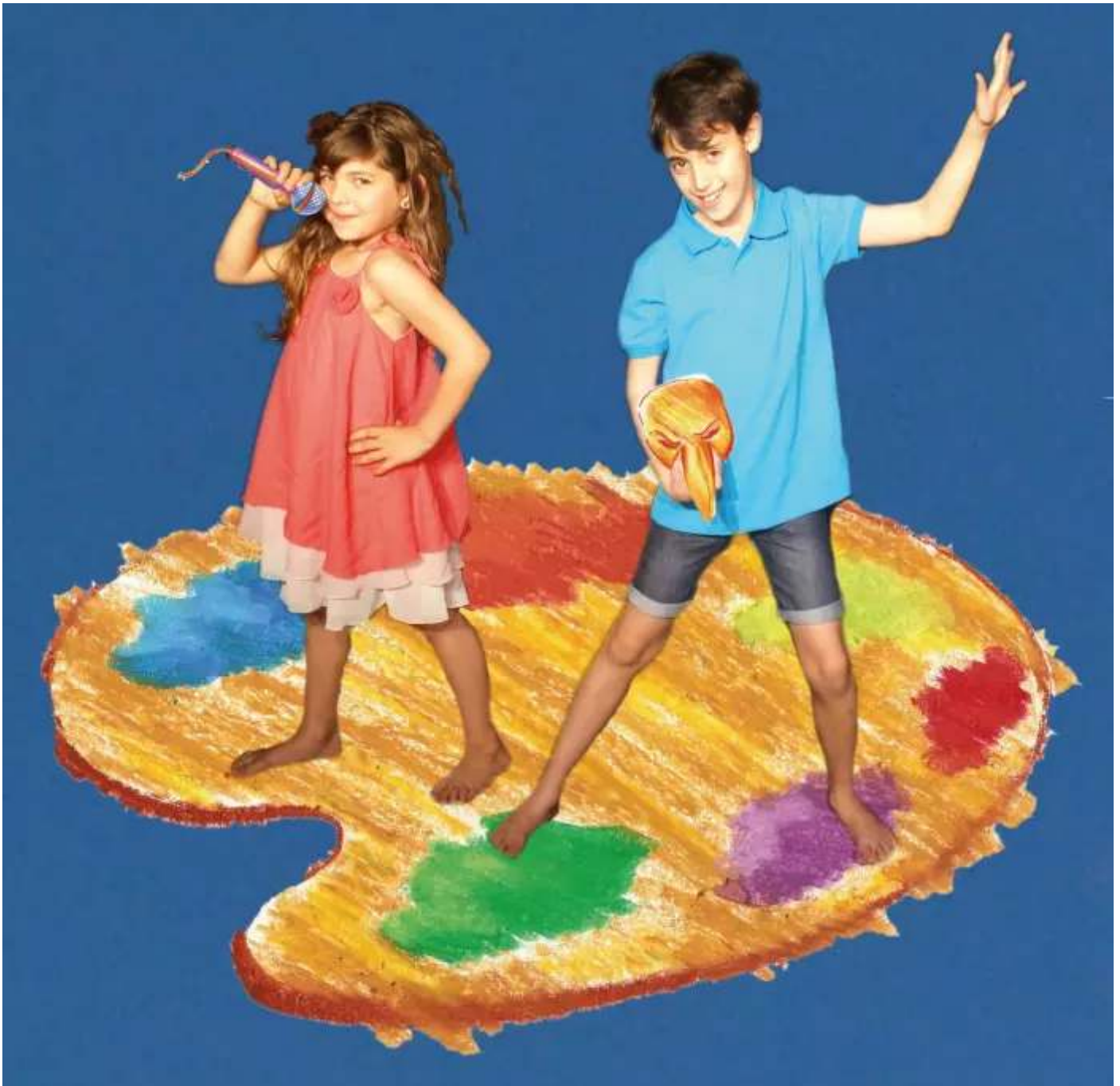
קייטנת כל העולם במה (איור: דודי שמאי)