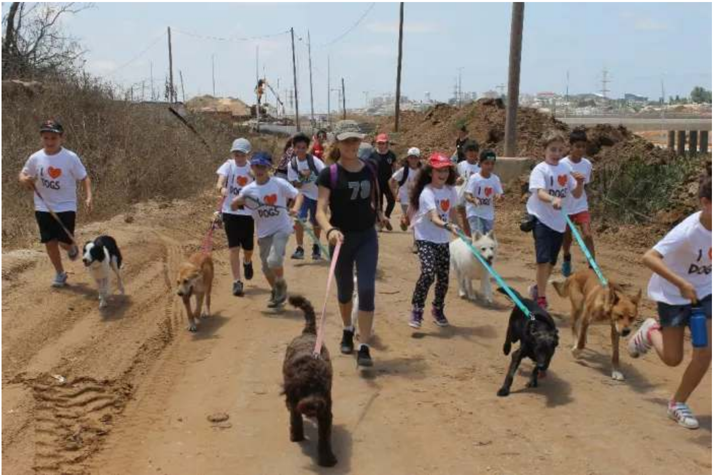
קייטנת מאלפים צעירים