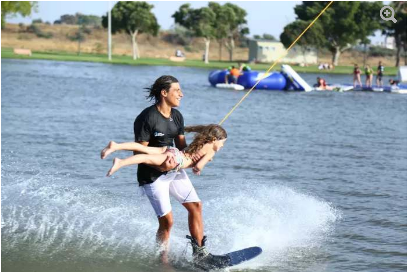
קייטנת laketlv