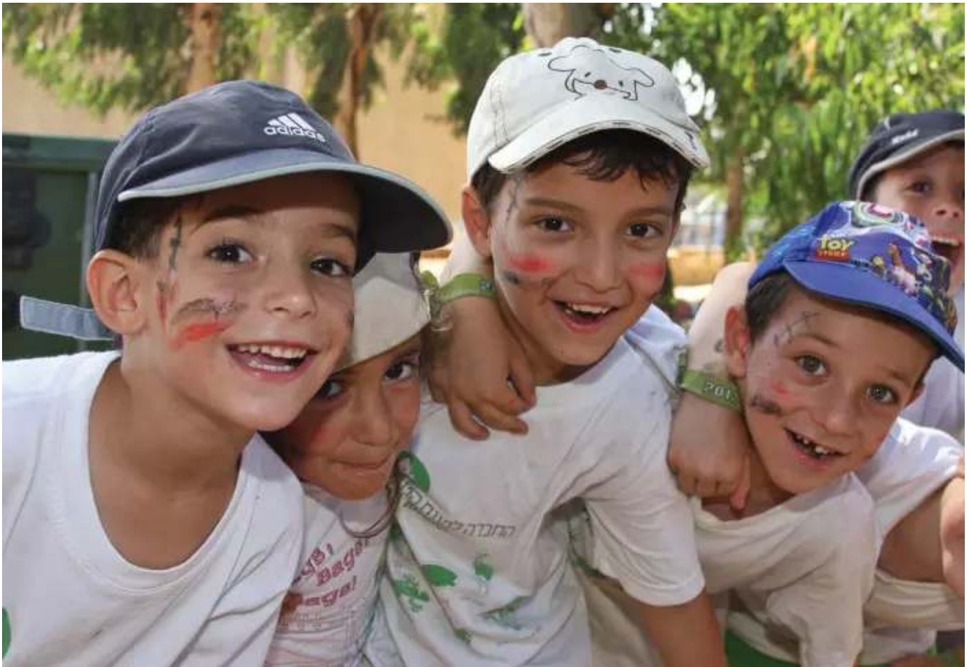
קייטנה של החברה להגנת הטבע