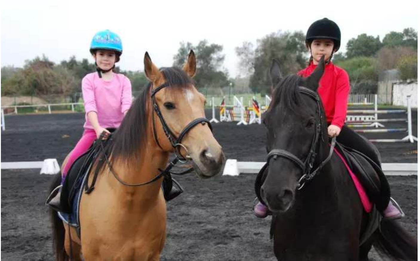
קייטנת רכיבה על סוסים