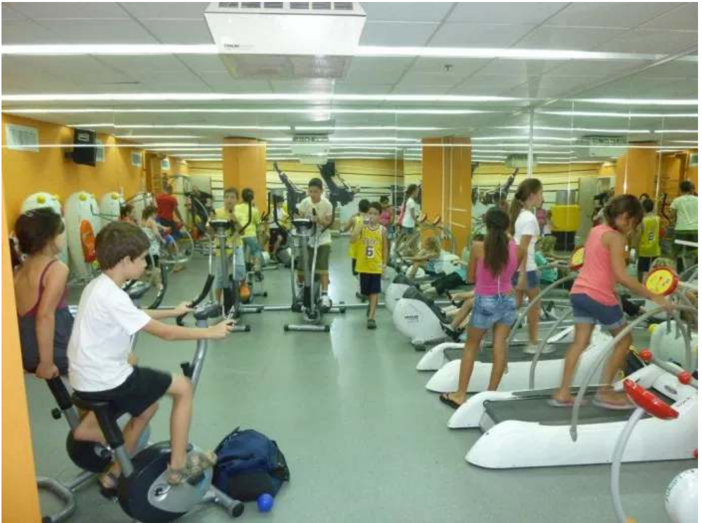
קייטנת גו אקטיב