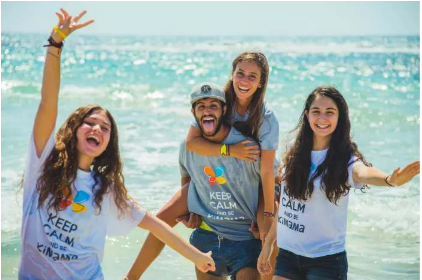
מחנה קיץ של קימאמה