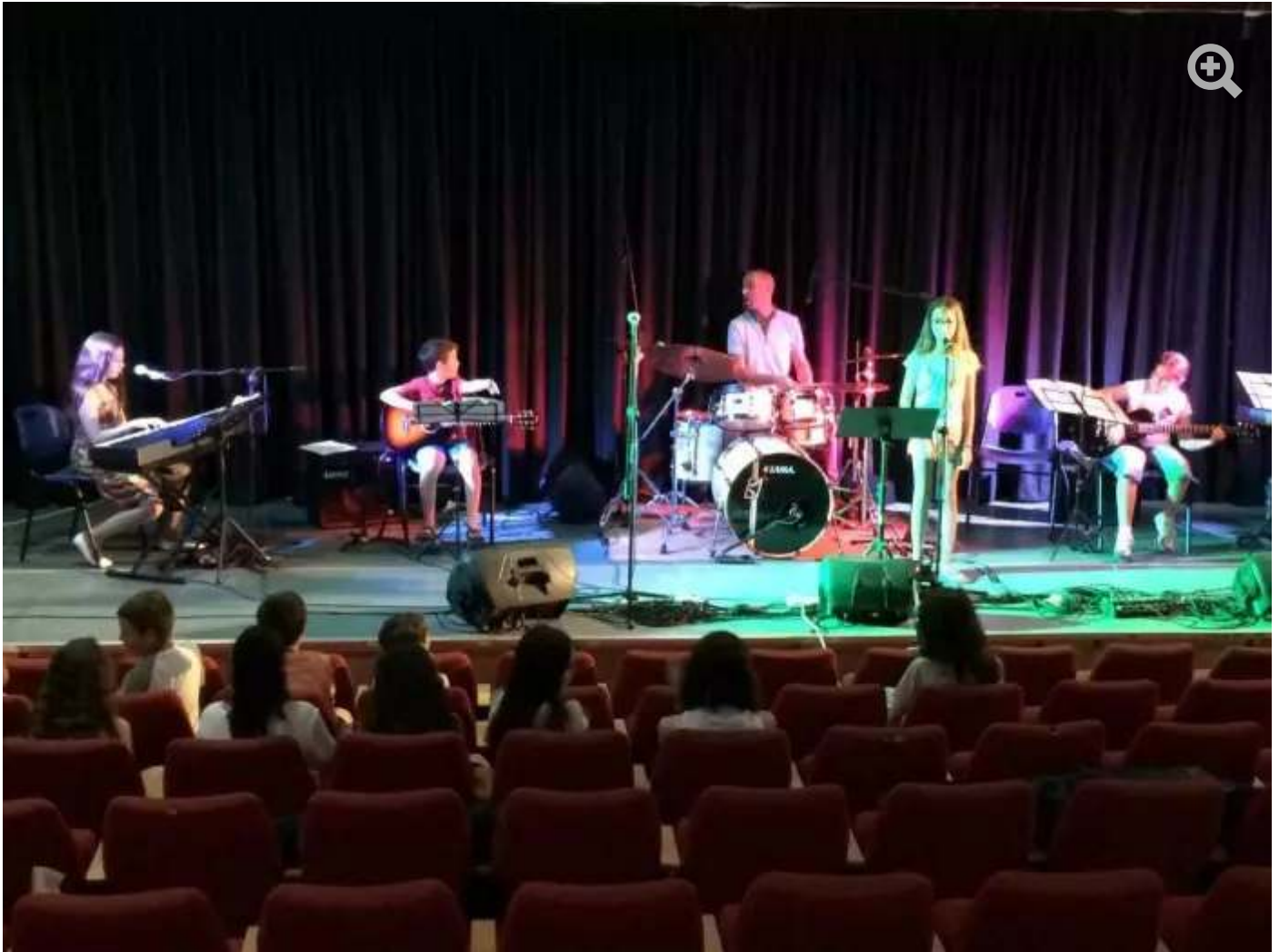
קייטנת לימונצ'לו

פרטים נוספים: עומר 052-5951982, איתי 052-4553155