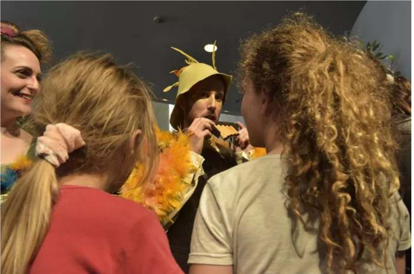
קייטנת האופרה הישראלית