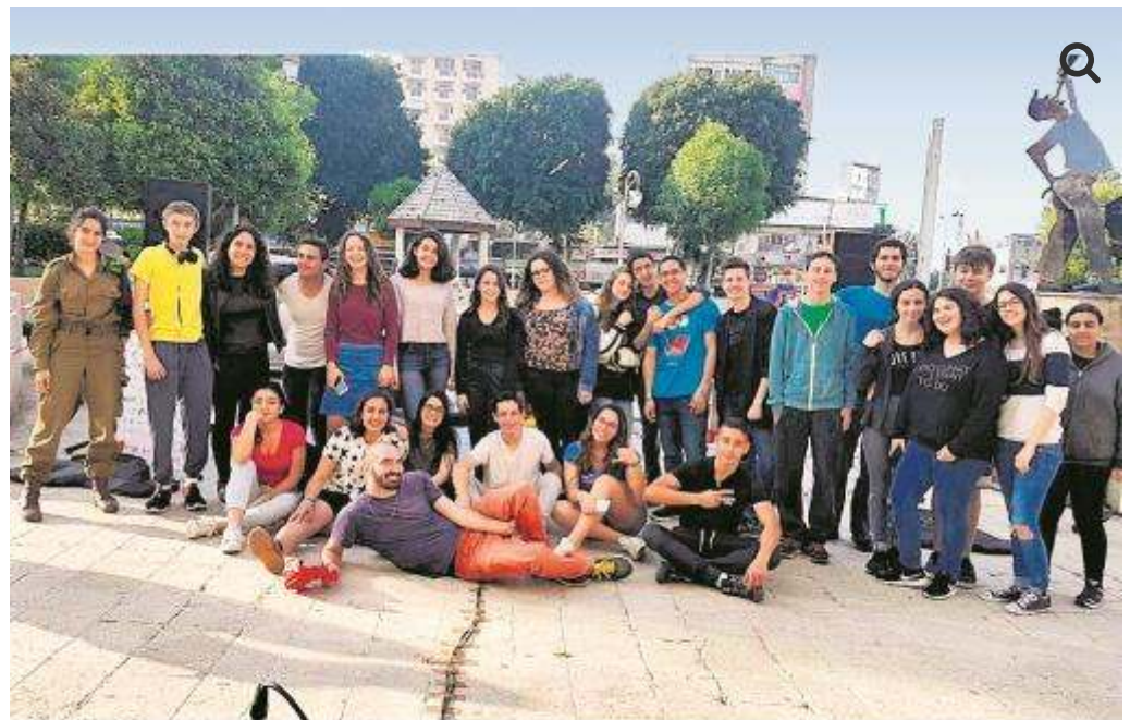
משתתפי הפרויקט.

במשך חודשים ארוכים השתתפו חניכי מרכז המוזיקה "ווליום ורבר" בסדנאות כתיבה, יצירה והלחנה. התוצאה היא אלבום שירים פרי עטם בשם "לגדול בפתח-תקוה", שהושק בשבוע שעבר ומבוסס על הפחדים, החששות, הכאבים והציפיות בתקופת גיל ההתבגרות. "הם הבינו מה זה להיות מוזיקאי בימינו, ואיך אפשר להשפיע על החברה והתרבות", מספרים המדריכים