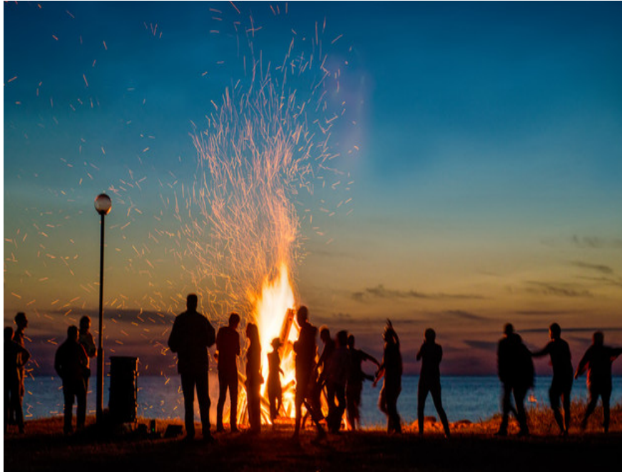
חג האור עבור חלק, חשוך במיוחד לאחרים

מערכת הורים | mako | פורסם 21/05/19 07:04