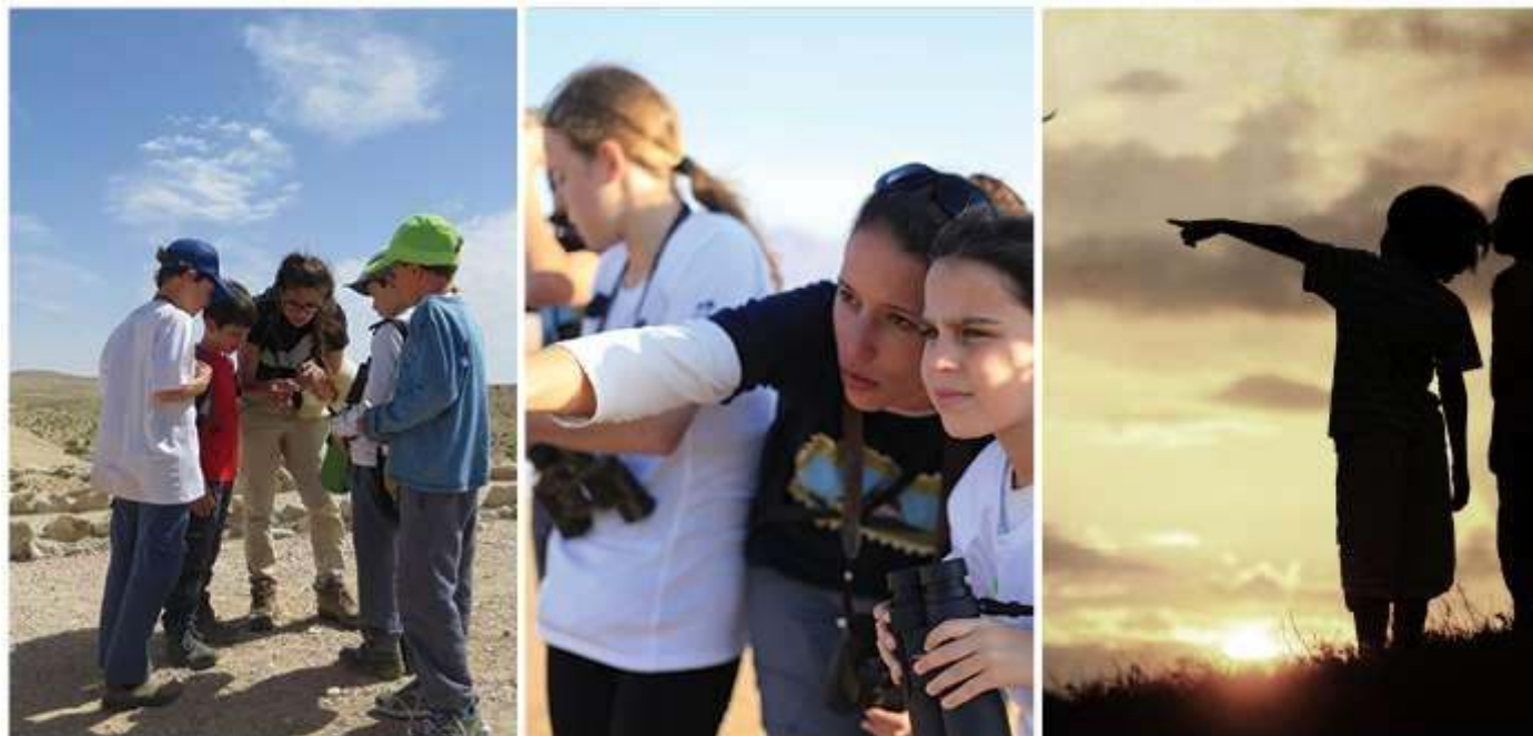
© סופק על ידי וואלה! חוג צפרות של החברה להגנת הטבע (צילום: יח"צ)

חוג צפרות של החברה להגנת הטבע (צילום: יח"צ)