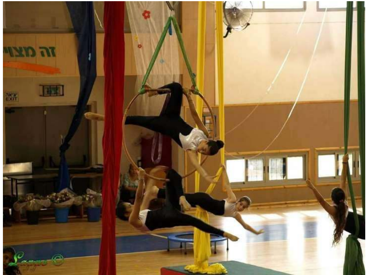
חוג אקרובטיקה אווירית