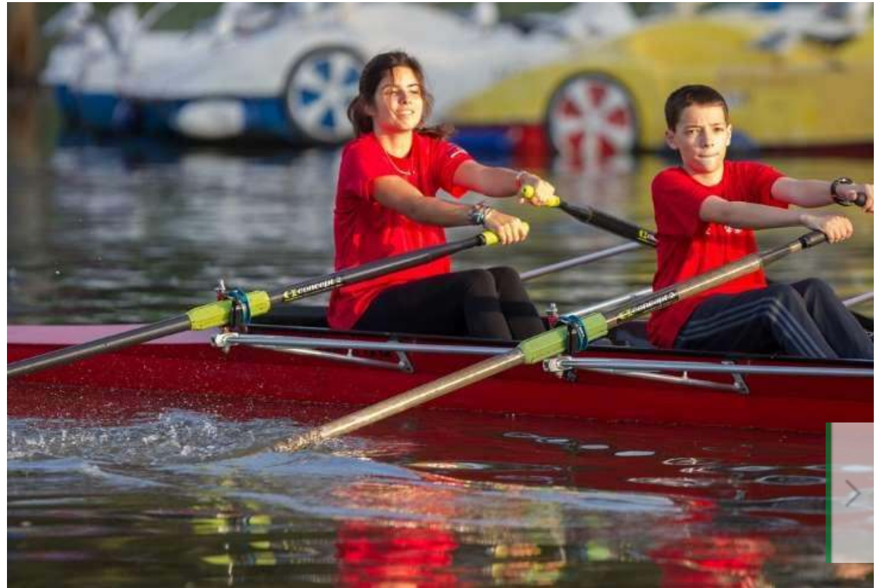
חוג חתירה

"אחרי החגים" היא התקופה שבה ההורים, במיוחד לילדים בגיל היסודי והגיל הרך, מקבלים החלטות סופיות לגבי החוגים שבהם יבקרו הילדים במהלך השנה. החלטה זו מלווה לא פעם בחששות מפני חוסר ההתמדה בגילאים אלה, מה גם שלרוב ההרשמה כרוכה בעלות של מאות שקלים לחודש ולעיתים