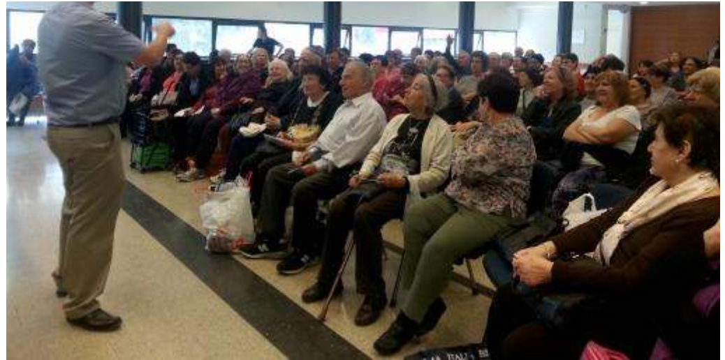
בריא בקהילתי.

בריא בקהילה: מינהל קהילתי 'גינות העיר', מבית החברה למתנ"סים הארצית, מזמין את בני הגיל השלישי לסדרת הרצאות בנושאי בריאות ואיכות חיים. ההרצאות הינם בשיתוף פעולה עם בית החולים שערי צדק.