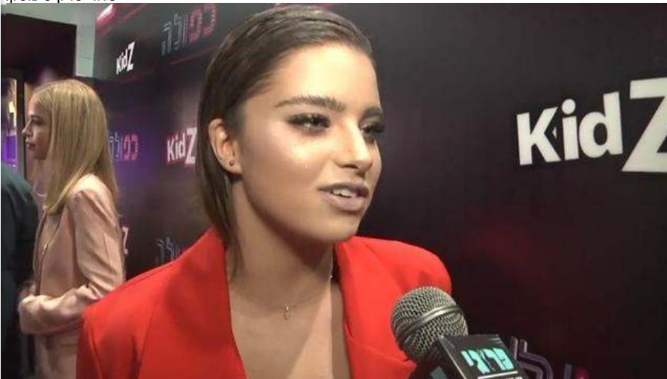
השקת הסדרה כפולה