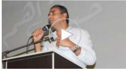
بعد ان فقدت تسعة من أبنائها في حوادث العمل، يافة الناصرة تعقد مؤتمرا بعنوان حياتي اهم (/Article-1387008/)