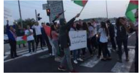
عقب اطلاق سراحه... لؤي خطيب: الايام المقبلة ستشهد تصيدا (/Article-1387021/)