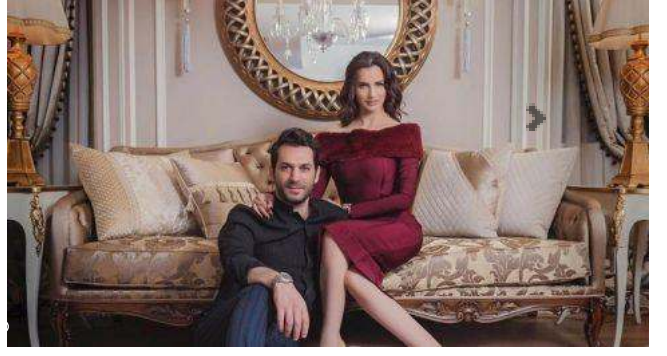
مراد يلدريم وايمان البانتي ثنائي الحب الأكثر شعبية في العالم العربي