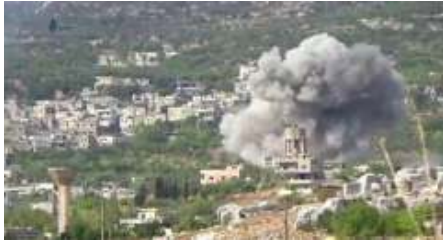
كيف قرأ فلسطينيو الـ 48 العدوان على سوريا؟ (/Article-1387005/)