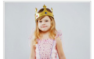
פורים בעולם מקביל - כל הילדים רוצים להתחפש

פורים בעולם מקביל - הכל מוכן, התחפושות מסודרות, הילדים מתעוררים בזמן, מצחצחים שיניים ומתארגנים ליום הנפלא הזה בחיוך. הם מתאפרים בשמחה ובעיקר מתייצבים לצילום המשפחתי בסלון, מחייכים למצלמה. הכל נשמע כמו סצנה מסרט הוליוודי, כי בפועל, זה לא בדיוק ככה.