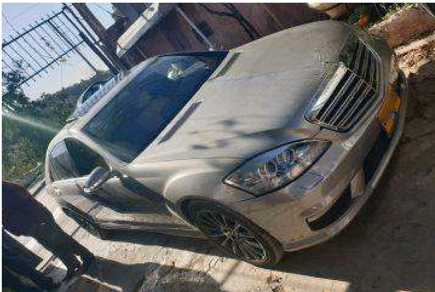
בן 13 נתפס נוהג במרצדס 'של סבא'