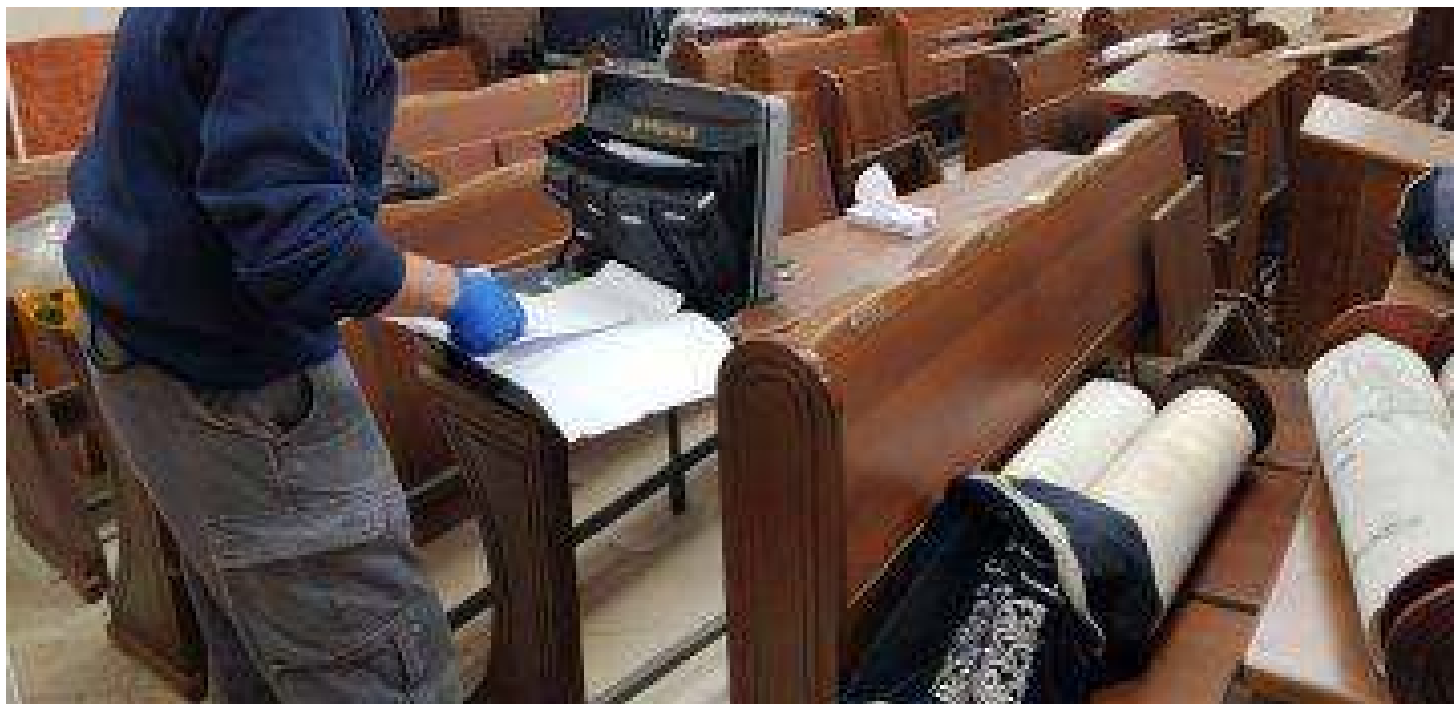
הרבנים קבעו: תענית ציבור בירושלים