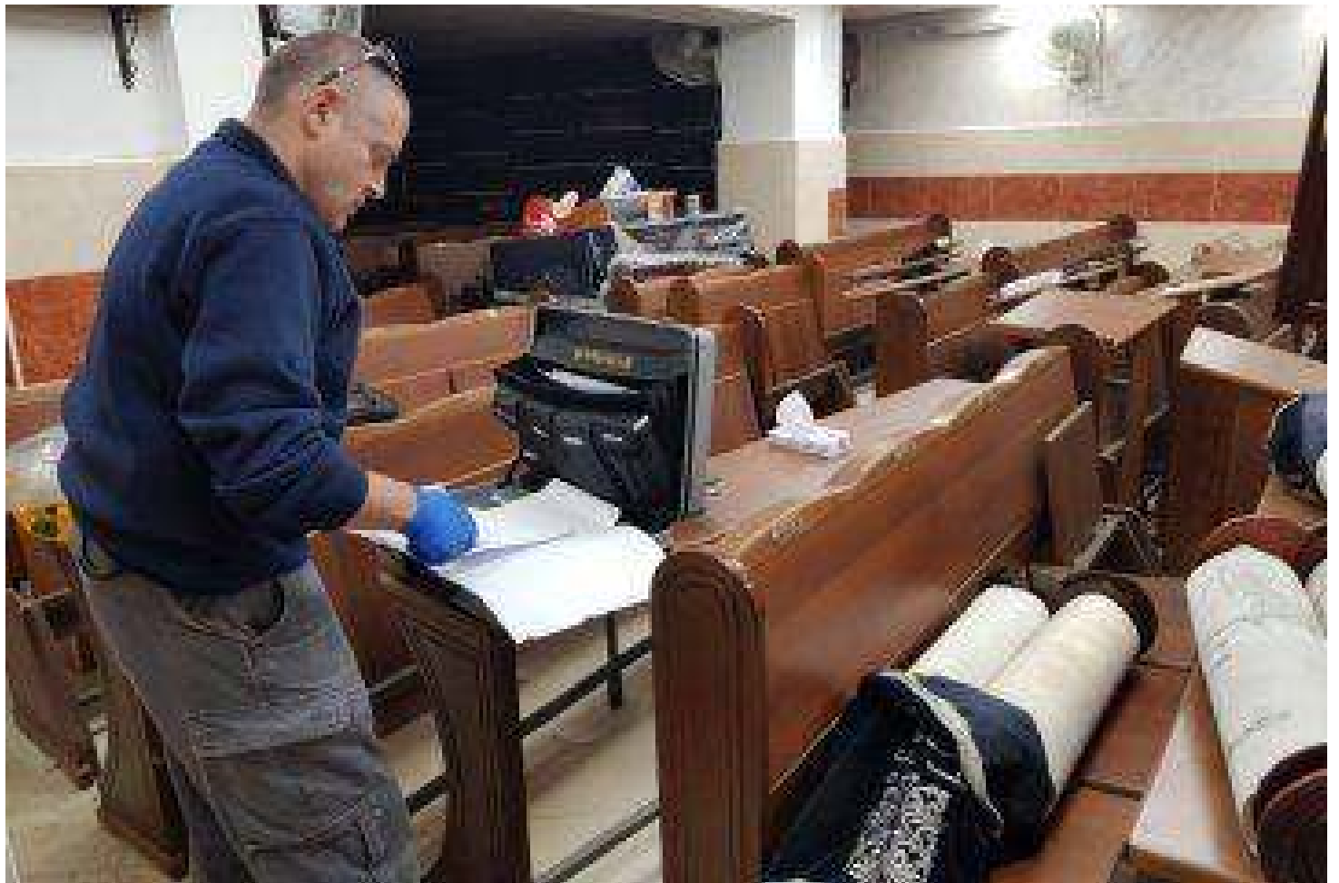
חילול בית הכנסת בשל חילול שבת