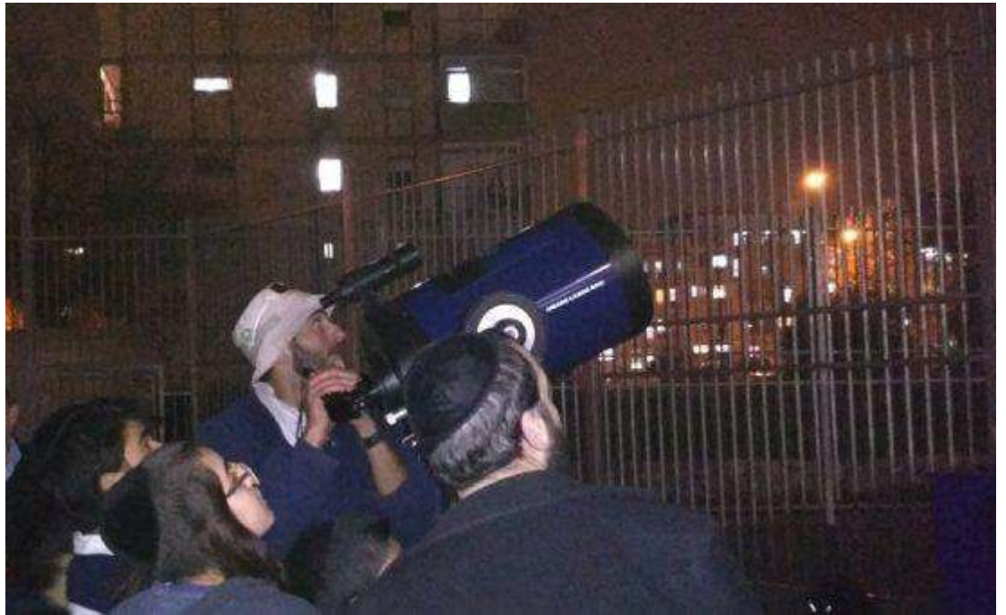
שבוע החלל הישראלי במתנ"ס אשכולות מאושר לפרסום קרדיט